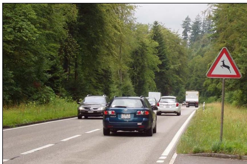
Längwald et l'axe entre Aarwangen et Niederbipp

Un rapport approuvé par le Gouvernement bernois en 2006, le "Concept Cerf Noble", prévoit que ce cervidé puisse s'établir dans l'ensemble du canton. Au cours des trois dernières années, le cerf a pénétré dans le secteur du Längwald , dans le nord-est du canton de Berne, où sa population atteint aujourd'hui une vingtaine de bêtes.